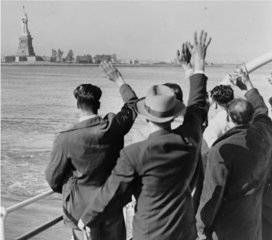
Archivio, Quotidiano Sociale, Siciliani entrano festosi negli Stati Uniti, 1921, Archive sicilian emigrants enter to NYC, source Quotidiano Sociale, 1921