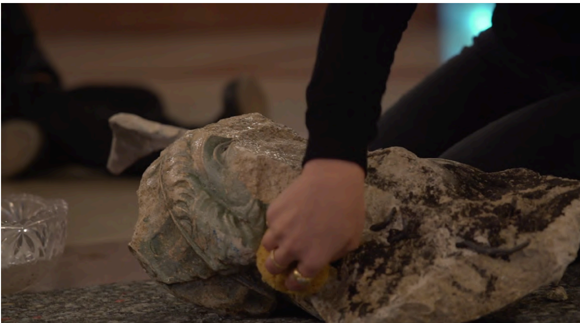
g. olmo stuppia Archéologie du Futur, INHA, Paris ,2019 https://www.tribune.com/dal-mondo/2019/11/performance-g-olmo-stuppia-parigi/