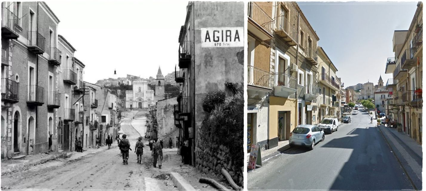
Agira nel/in 1943 e Agira oggi/today